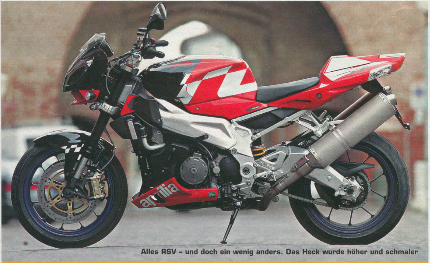
Alles RSV – und doch ein wenig anders. Das Heck wurde höher und schmaler

„Superbike ohne Verkleidung“ nennt Aprilia die Tuono und spricht von der neuesten Version nur in Superlativen. Einer ist dem Donnergott garantiert nicht zu nehmen: der für den intensivsten Blick.