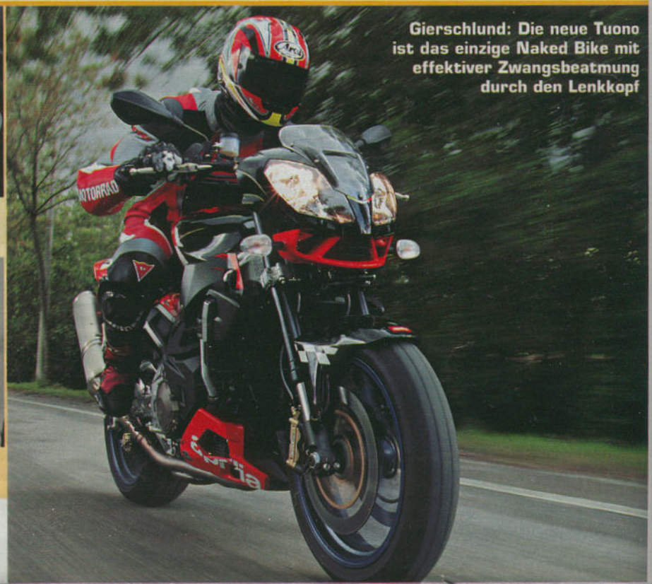
Gierschlund: Die neue Tuono ist das einzige Naked Bike mit effektiver Zwangsbeatmung durch den Lenkkopf