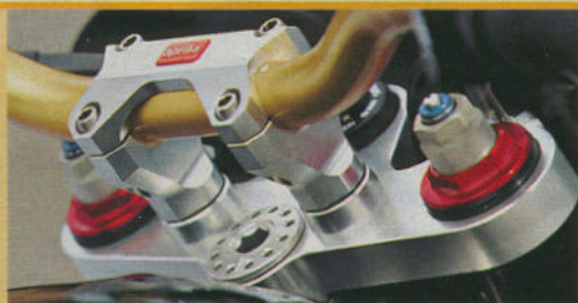
Fein gemacht: gefräste Lenkeraufnahme, goldenes Lenkerrohr, 43er-Gabel

Derart fahraktiv und dennoch bequem untergebracht, lässt es sich aushalten. Und auf jene Augenblicke harren, die das Streetfighterleben wirklich ausmachen. Wenn endlich die Straße abtrocknet. Wenn langsam die Sonne durchbricht – oder wenn die Tuono mit bösem Blick den Gegner ins Visier nimmt. Jetzt erst recht. ■