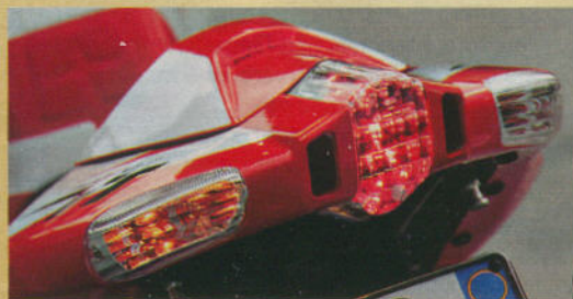
Formensprache: elegantes Heck mit LED-Rücklicht und Blinkern