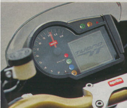
Laptimer, Schaltblitz, Wegfahrsperre: Im neuen Cockpit ist alles da